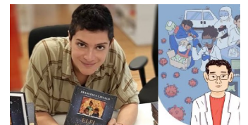
新冠肺炎 國際觀察