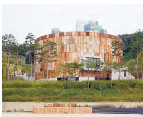
文化儲備基地周二至周日開放，遊客可免費參觀。

韓國有着許多活化再生的精彩景點，其中包括位於麻浦區的文化儲備基地。原本一處 40 餘年不為市民所知的儲存石油的秘密基地，近年來脫胎換骨變成舉辦慶典、表演、展覽、市集的環保複合文化空間，去首爾遊玩的朋友不要錯過！石油儲備基地建於上世紀 70 年代，為了防止石油價格動盪對該國經濟產生影響而建造。基地廢棄後，原有的 5 個儲油槽被重新利用，分別建成玻璃展館、演出場地、石油儲油槽原貌、文化複合空間、故事館，不僅保存了其歷史價值、發展可持續生態，還可以令其繼續為市民服務，舉辦有關環境、文化、藝術等各色主題的展覽。曾為臨時停車場的寬闊戶外空間，則成了文化廣場，為市民提供休憩和舉行社群活動的空間。