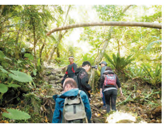
「森林探險」活動歷時約 4、5 個小時，旅客須提前預約。