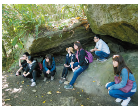
記者與行家懷着虔誠的心情，聆聽部落古老的傳說，體驗族群的遷移。