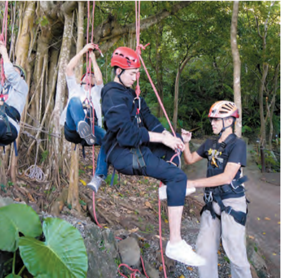
攀樹需要較多的體力，坐在樹上看海不失為一種有趣的體驗。

高山森林基地 地址：花蓮縣豐濱鄉磯崎村高山一鄰 2 號(往山上) 郵箱：gsforest.com@gmail.com 網址：http://www.gs-forest.com (旅客可搜索高山森林基地 Facebook 粉絲專頁，獲取即時活動資訊。)