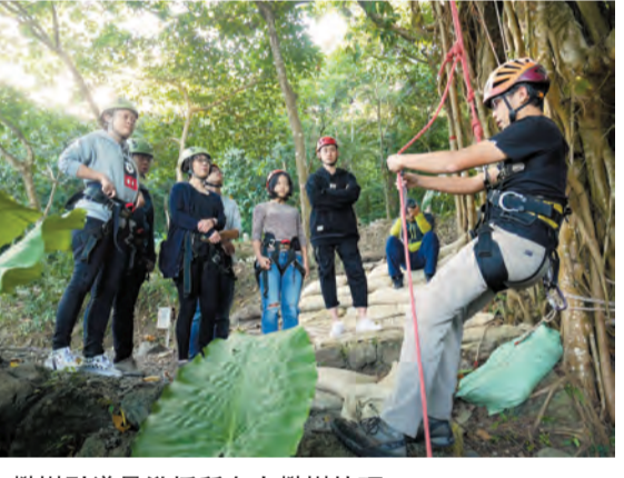
攀樹引導員教授所有人攀樹技巧。