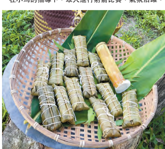
對上山狩獵的勇士來說，「阿拜」是很好的一個主食及裹腹的食材。