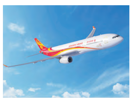
香港航空去年準點率達 88.11%。

過去一年，你坐過幾趟飛機？又延誤過幾次呢？香港機場是全球最繁忙機場之一，成立於 2006 年的香港航空在準點率方面亦表現出色。據 OAG 2019 年準點率綜合報告顯示，香港航空準點率再度榮登亞太地區航空公司榜首，全球名列第三。作為全球首屈一指的旅行資料提供商，OAG 自 1929 年以來一直為航空旅行生態系統的成長與創新提供助力。該報告是最全面性的全球航空公司和機場準點率(OTP)年度排名。位列亞太榜前三名的香港航空、曼谷航空和澳洲航空，都躋身全球前十名；曼谷航空、阿斯塔納航空和亞洲天網航空是三家新打入本年度亞太地區準點率前十名的航空公司；中國三大航空公司——中國南方航空、中國東方航空和中國國際航空，2018 年的準點率有明顯改善，分別位居全球第 15 名、第 17 名和第 19 名。