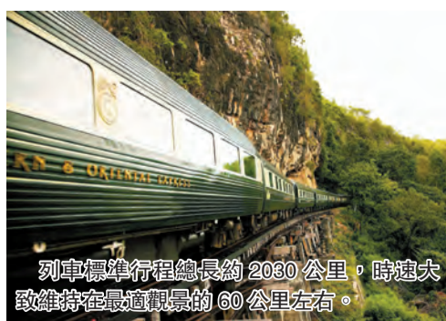
列車標準行程總長約 2030 公里，時速大致維持在最適觀景的 60 公里左右。

旅行的方式有很多，除了上天下海的飛機和郵輪，旅客還可以選擇乘搭火車鐵路，緩慢地欣賞沿途風景。亞洲東方快車是亞洲最豪華的夢幻列車，穿梭於泰國、新加坡、馬來西亞菁華路線，這列充滿南洋風情的豪華列車，滿足了乘客追求舒適、悠閒旅程的夢想。東方快車將與著名國際廚藝大師聯袂推出 2019 年度系列「快閃」美食活動。2 月 5 日起，在三晚的曼谷——新加坡之旅中，新加坡糕點廚師 Janice Wong 將在列車行程中展現其對甜品和烹飪藝術的熱愛；3 月 1 日起，Mangan 帶領的美食探險之旅將在新加坡啟程，乘客與他一同前往當地市場嘗街邊小吃，隨後登上列車開始兩晚的曼谷行程；9 月 2 日善於融合越南與法式料理精髓的法國主廚 Didier Corlou，將獻上「四手」晚餐、特色下午茶，以及小型「香料工作坊」展現 30 年的烹飪技藝及其對東西方風味融合的癡迷。